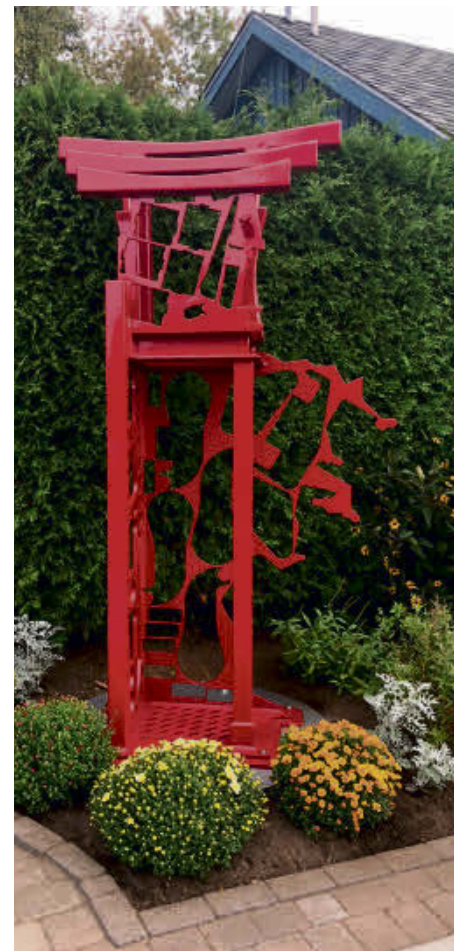
Les sculptures de Claude Millette, pouvant ressembler à celle-ci, seront intégrées à différents endroits du Jardin pour l'occasion.

lancé une campagne de sollicitation financière pour la réalisation de tous ces projets, avec un objectif de 100 000 $.