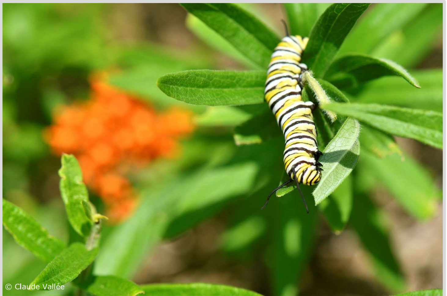
Asclepias tuberosa (Asclépiade tubéreuse)