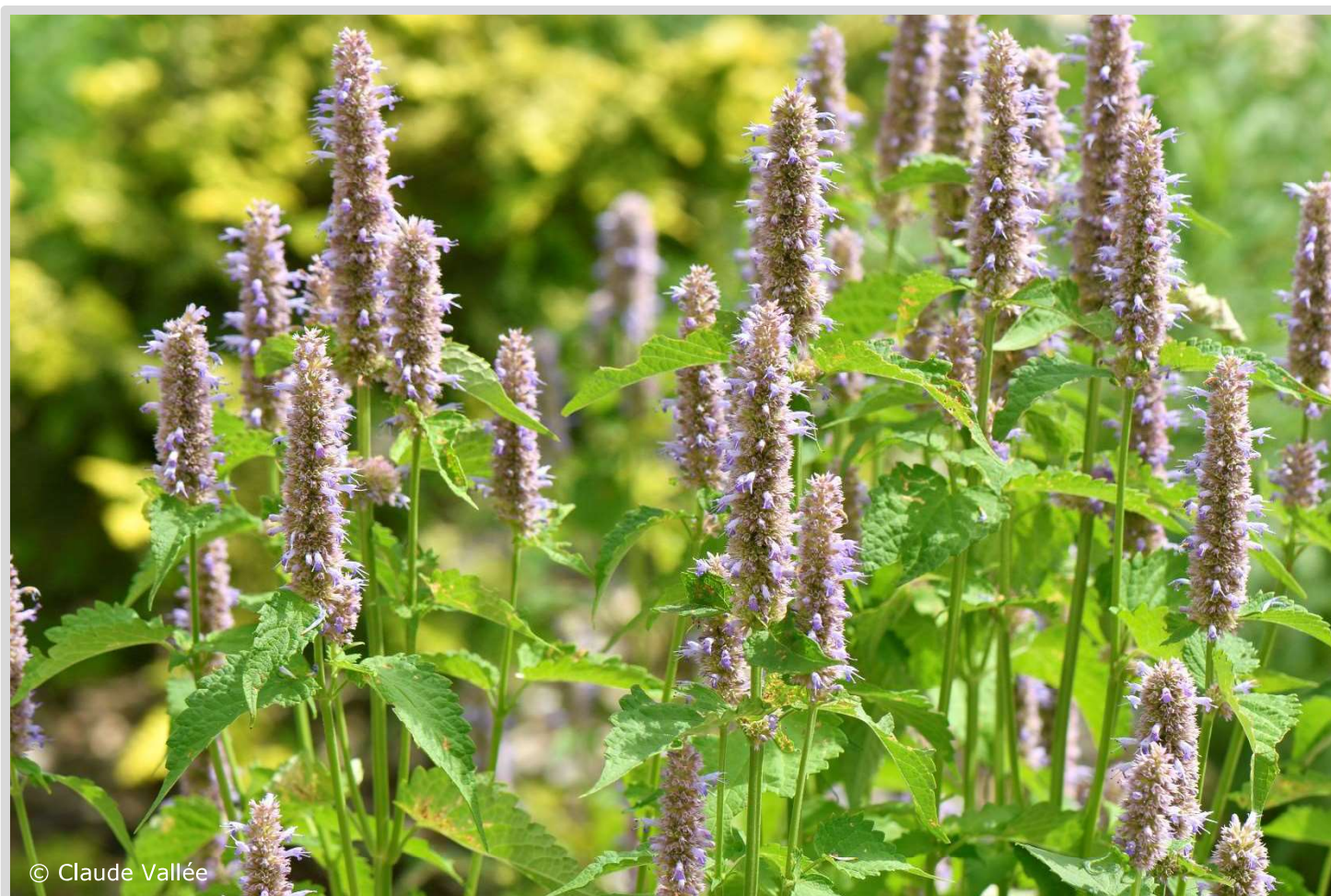
Agastache foeniculum (Agastache fenouil)

Favoriser les cultivars aux fleurs simples plutôt que doubles, car le nectar est plus facile à atteindre pour le papillon.